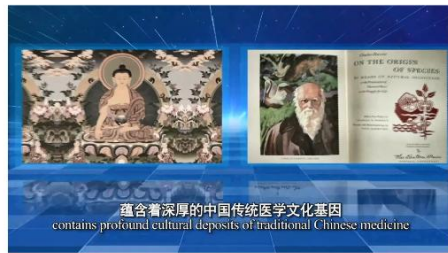
蕴含着深厚的中国传统医学文化基因 contains profound cultural deposits of traditional Chinese medicine

“凡是中国的，也是世界的。”秦教授强调，中国人要创新，就要用中国的方式，这样才能赢得世界的尊重。