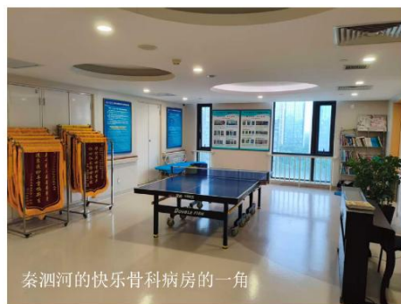
秦泗河的快乐骨科病房的一角